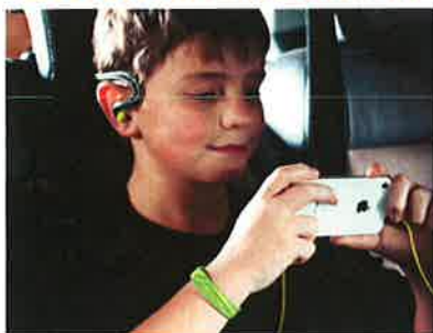
Nogle steder har man oplevet en forbedring af børns hukommelse og koncentrationsevne

I årtier har forskere og læger over hele verden dokumenteret, hvordan negative ioner har en positiv effekt på forskellige miljøer og mange menneskelige forhold. Generel rensning af luften, hvilket forhindrer respiratorisk relaterede sygdomme og modvirker skader fra rygning, anti-deprimerende, forbedring af søvn og forebyggelse af astma og allergi, er blot nogle af de bemærkelsesværdige virkninger man har fundet.