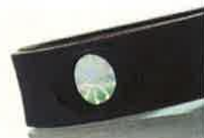
Hologrammet er en af de vigtige bestanddele, der øjeblikkeligt kan påvirke din balance